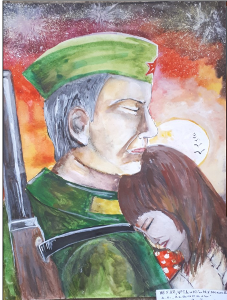
НЕ УДО, ЧРТА, ЧОГО НЕ МОЖЕШЬ Д. С. А. А. ШИШОВ